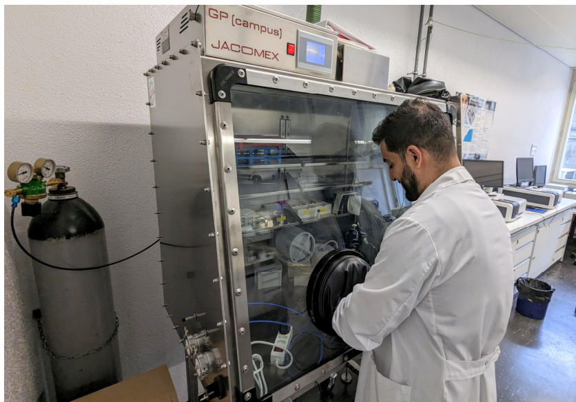
Abbildung 2: Anaerobes Arbeiten ist in einer sogenannten Glove-Box, welche mit Stickstoff gefüllt ist und keinen Sauerstoff enthält, möglich. Chemikalien und Geräte werden durch Schleusen transferiert, und die Manipulation im Innern erfolgt durch die übergrossen Handschuhe.

Das Team um Prof. von Ballmoos untersucht den molekularen Mechanismus von diesem und anderen Proteinen, die bei der Darminfektion eine Rolle spielen. Ein unerlässliches Hilfsmittel ist dabei die zeitaufgelöste Messung von Absorptionsspektren in UV- und in sichtbarem Licht, welche erlauben, den Proteinen in Echtzeit bei der Arbeit zuzuschauen. Bei den Untersuchungen der Superoxid-Oxidase kommt allerdings erschwerend dazu, dass gewisse Messungen in Abwesenheit von Sauerstoff durchgeführt werden müssen, analog der sauerstofffreien Umgebung in unserem Dickdarm. Diese Untersuchungen werden in einer sogenannten Glove-Box (Abb. 2) durchgeführt, welche mit Stickstoff gefüllt ist und darum geschlossen sein muss. Man ist dabei nicht nur räumlich eingeschränkt, man muss bei der Arbeit auch spezielle Handschuhe tragen, welche das Bedienen von Apparaturen im Innern sehr aufwändig machen.